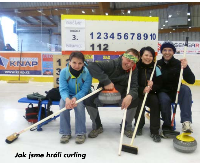
Jak jsme hráli curling