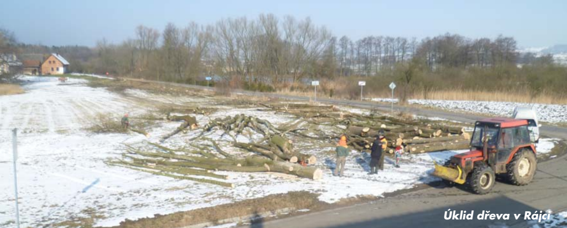
Úklid dřeva v Rájci